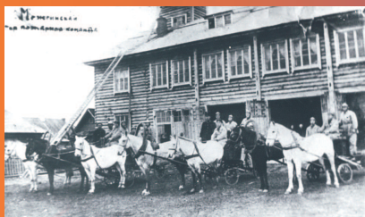
Спасение людей - достоинство отважных