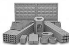
Конструкции и детали сборные железобетонные