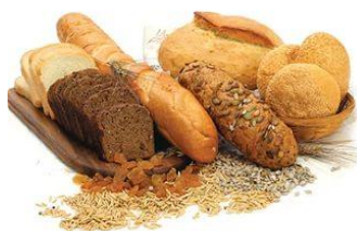
Изделия хлебобулочные недлительного хранения